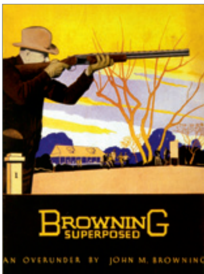
První leták z roku 1931 propagující Superposé v USA

Záhy po jejím konci se Browning do Herstalu vrátil a zpřetrhané pouto obnovil. V roce 1922 začal konstruovat novou zbraň – loveckou brokovou kozlici. V té době byly kozlice extrémně drahé zbraně, nepříliš rozšířené, používané jen tím málem střílců, kteří si je mohli dovolit. J. M. Browning na konstrukci zbra-