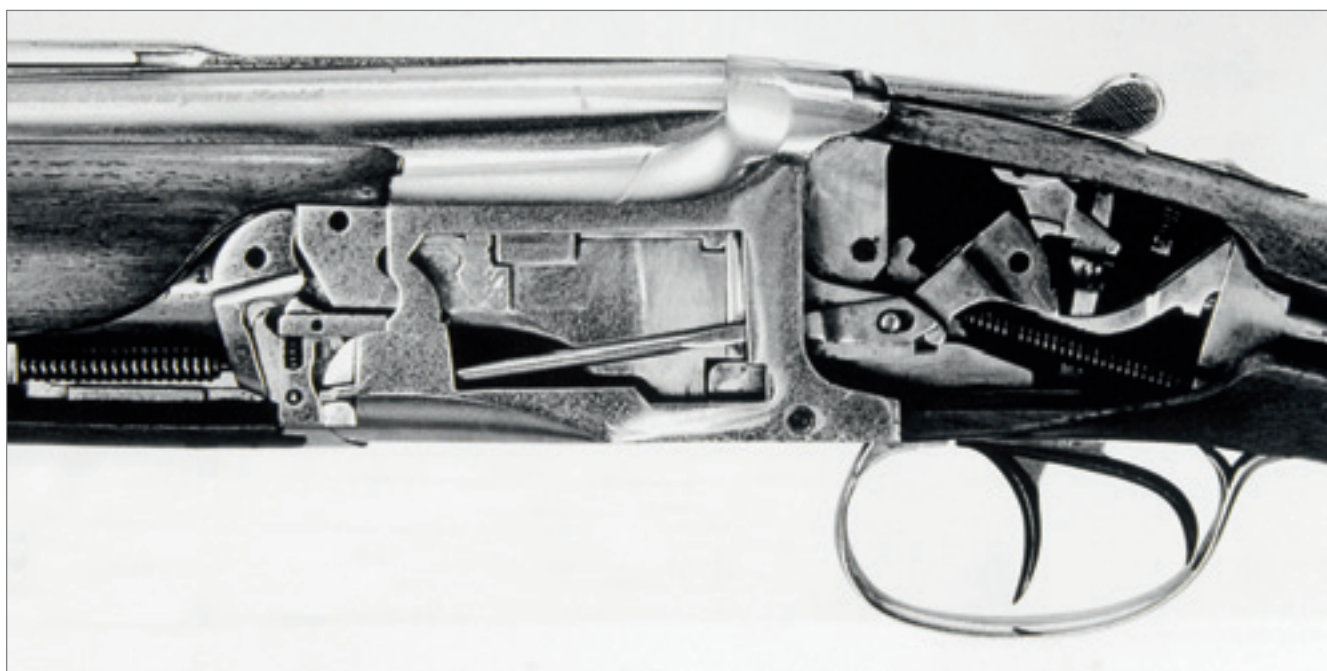
Instruktažní řez původním provedením Superposé z roku 1930 ještě se dvěma spouštěmi. Konstrukce (s výjimkou jednospuště) doznala jen minimálních změn.

FN kupodivu neměla v té době mnoho volných kapacit a razantně rozšiřovat se bála. Ona to obecně nebyla příliš lehká doba pro žádnou evropskou zbro-