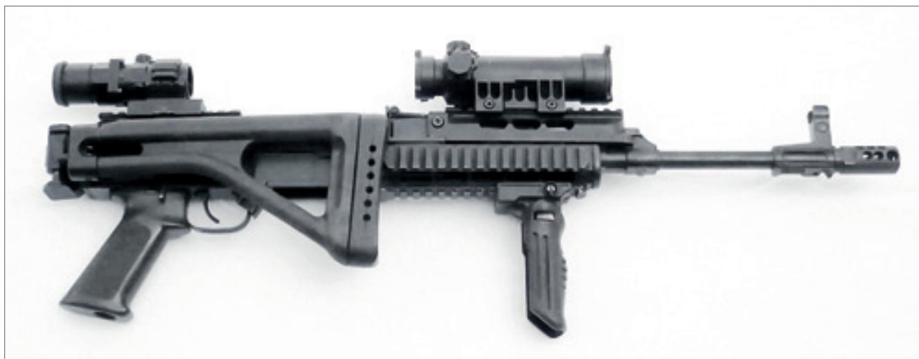
◀ Kinggun se sklápou pažbou typu Galil, namontovaným kolimátorem na nadpažbí a zvětšovacím modulem ke kolimátoru na krytu závěru