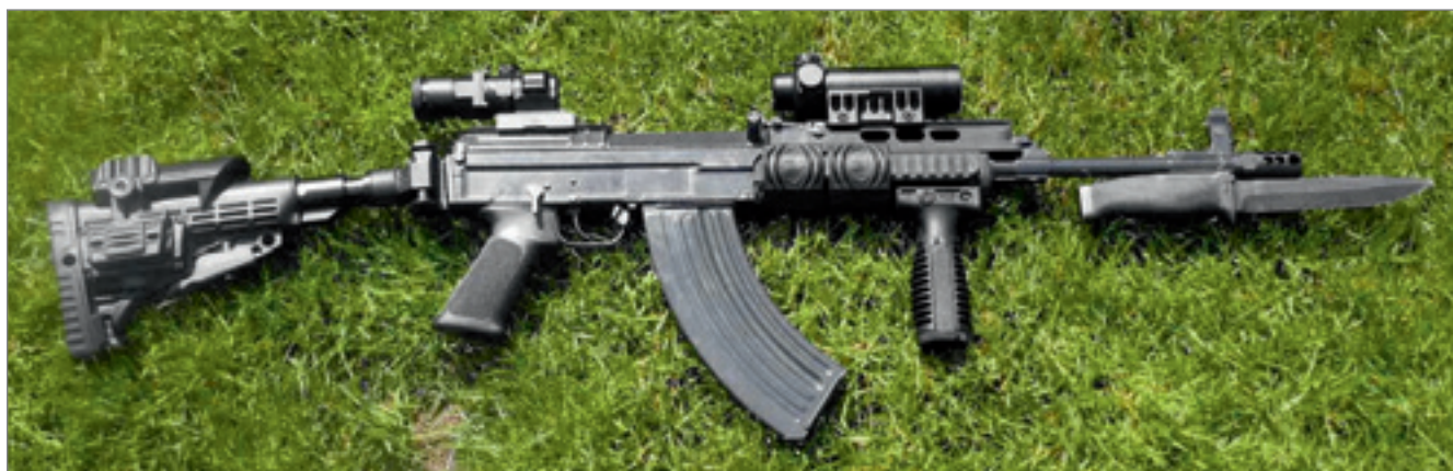
◀ Sa 58 modernizovaný podle návrhu Kinggun

Návrhy na modernizaci útočné pušky Sa 58 se objevily už před rokem 1989 a v posledních letech nejméně jedna firma každý rok předvádí jeden nebo víc doplňků na tuto zbraň. Další impulz přineslo schválení civilních verzí osmapadesátky a její používání pro sportovní střelbu. Zajímavý a komplexní návrh modernizace představila zatím málo známá firma Kinggun z Přerova.