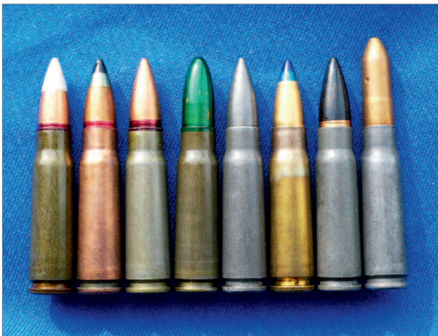
◀ Různá provedení vojenských nábojů 7,62x39

Krabička na náboje dodávaná čínskou firmou Norinco obsahovala celoplašťové náboje. Další krabička je od firmy Kopp.