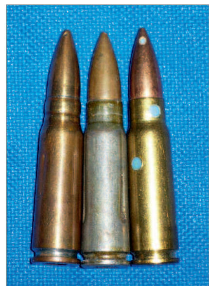
◀ Školní náboje: 539 – Tula, bxn – Sellier & Bellot, Vlašim, PPU – Jugoslávie