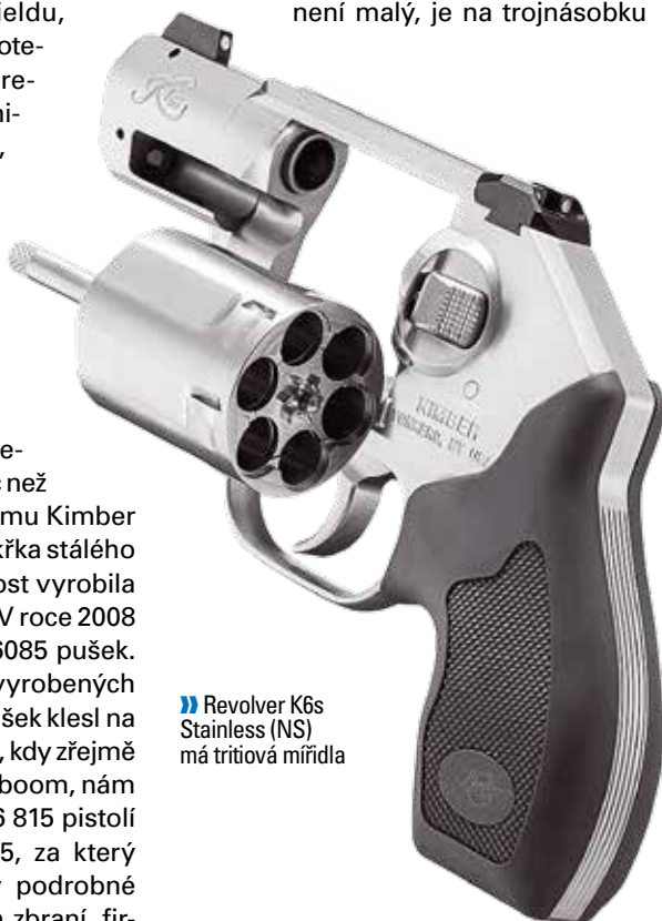
» Revolver K6s Stainless (NS) má tritiová mířidla

šek. Zatímco pušky šly rapidně nahoru, u pistolí zaznamenáváme oproti roku 2013 pokles o nějakých 10 %. Za čas, až budou publikovány údaje z roku 2016, uvidíme, jak na firmu zapůsobil efekt Hillary. V každém případě Kimber není malý, je na trojnásobku