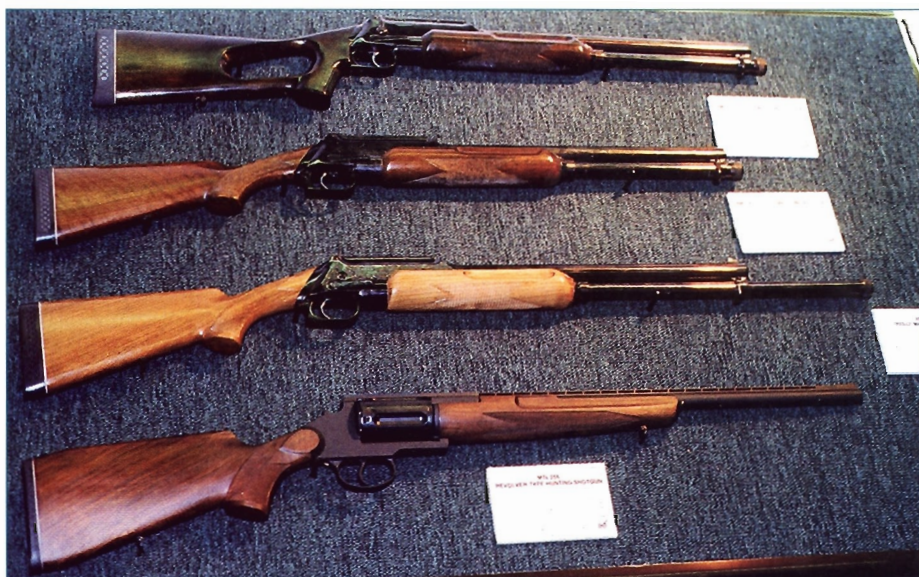
Kuriozity z ruské expozice: brokové „pumpy“ se zásobníkem nahoře a s pohyblivou hlavní, dole revolverová brokovnice