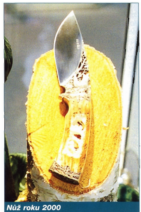
Nůž roku 2000

Premiéru na letošním veletrhu IWA měla mezinárodní soutěž o titul Nůž roku 2000, jíž se zúčastnili všichni výrobci nožů vystavující v Norimberku. A nebylo jich právě málo - rovných 150! Pověstinou zvučná jména jako Puma, Wenger, Victorinox, Webley, Rainbow, Opinel, Meyerco, Moteng, Muela, Kershaw, Gerber, Herbertz, Lansky, Leathermann, Ka-Bar atd. Šlo o hodně. Vítězný nůž se totiž stane v roce 2001 oficiálním motivem na