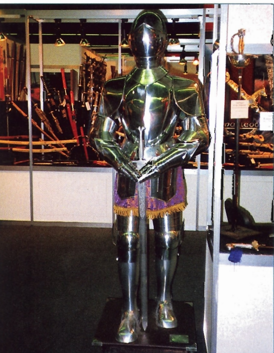
Ze stánku firmy Marto z Mittelbachu