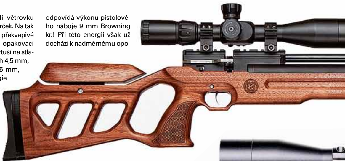
◀ Větrovka Cricket s klasickou pažbou

odpovídá výkonu pistolového náboje 9 mm Browning kr.! Při této energii však už dochází k nadměrnému opo-