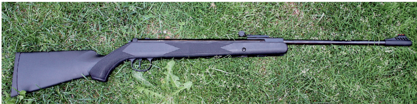
Xisico B25S je klasická lámací vzduchovka vybavená moderními mířidly. Plastová pažba vypadá velmi pěkně.

Pokud se v našem oboru začne mluvit o čínských výrobcích, zpravidla se skončí u nepřilíhů dokonalých klonů všemožných evropských či amerických zbraní. Číňané toho dělají pozhledně a z četných testů, které byly publikovány mimo jiné u nás ve Střelecké revui, vycházejí v posledních letech mnohé jejich zbraně jako nikoli špatné, s tendencí ke zlepšování kvality. Pochopitelně pochybných výrobků zůstává dost, ale těch dobrých je stále víc a začínají být zajímavé.