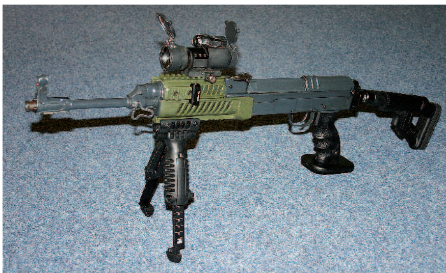
Upravená puška Sa 58 z ukázkové řady firmy Moravia Tactical. Na zbrani je aplikováno plastové předpažbí a nadpažbí VFR-VZ, dvojnožka T-POD, pistolová rukojeť SG 1 a pažba UAS.

Izraelská firma FAB Defense vyrábí doplňky na nejrozšířenější útočné pušky na světě a jejich klony. Máme na mysli M16/M4 a rodinu útočných pušek Kalašnikov. K tomu vyrábí doplňky na samopaly Heckler & Koch MP5, dva typy brokovnic a pistole Glock. Mezi doplňky pro tyto proslulé modely se zařadila také česká (československá) útočná puška vz. 58.