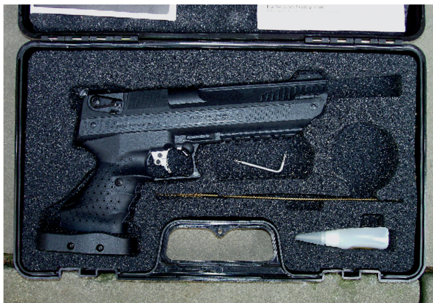
◀ V plastovém kufříku s pistolí Webley Alecto je vedle návodu k použití a nástřelky také montážní klíč, mosazný kartáček a olejníčka s trochou silikonového oleje

Spoušť je kovová, na první pohled velmi opečovaná, její součástky jsou vyrobeny z vyleštěných odlitků. Pomocí im-