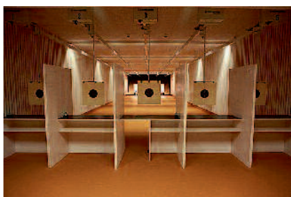
Celkem konvenční 25m střelnice s pěti stavy

Podobným střeleckým kinem, orientovaným navíc i na mysliveckou střelbu, je vybavena stometrová střelnice, umož-