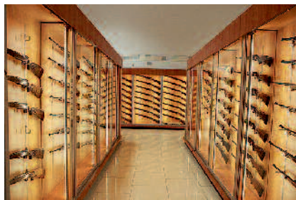
Reprezentační prodejna zbraní, střeliva a příslušenství

Na místě je totiž k dispozici nejen střelnice, ale také kvalitní puškař a neméně