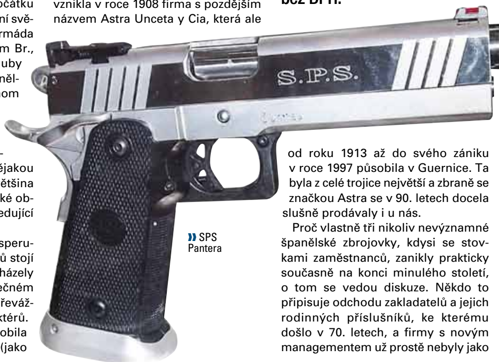
» SPS Pantera

Španělské zbrojovky kdysi zásobovaly celý svět pistolemi a případně i revolyery. Ta doba je dávno pryč, dnes se moderními pistolemi zabývá ve Španělsku jediná firma, která je však ve skutečnosti ani nevyrábí – nebo alespoň ne celé. Produkty se značkou SPS však jsou v mnoha směrech zajímavé a kvalitní, takže také nepatří k úplně nejlevnějším. Katalogové ceny španělského „výrobce“ se pohybují od 1000 do 1900 eur bez DPH.