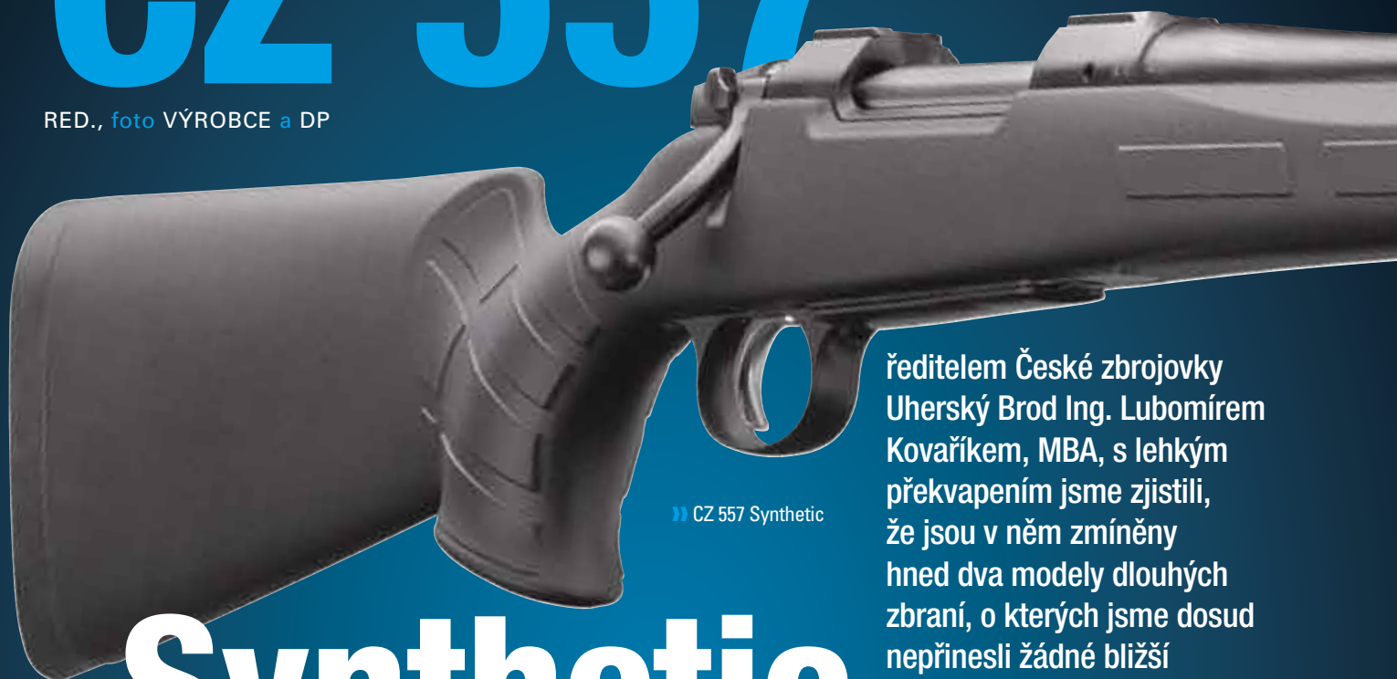
» CZ 557 Synthetic

Když jsme pro letošní červencové číslo připravovali rozhovor s generálním