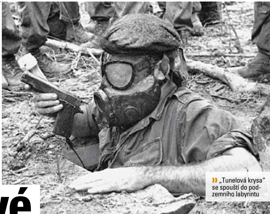
» „Tunelová krysa“ se spouští do podzemního labyrintu

Vietnam byl v polovině 20. století těžce zkoušená země, která byla součástí francouzské koloniální říše. Po porážce japonských okupantů v roce 1945, kteří paradoxně vyhlásili vietnamskou nezávislost, se vrátili bývalí kolonisté – Francouzi.