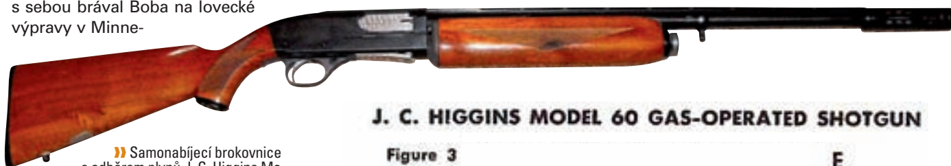
J. C. HIGGINS MODEL 60 GAS-OPERATED SHOTGUN

rové náboje 357 Magnum. Na základně námořního letectva Wold Chamberlain Field, kde tehdy sloužil jako záložník US Navy, vyrobil jeho funkční vzorek. V roce 1938 jej v Hartfordu předvedl konstruktérům společnosti Colt. Firma