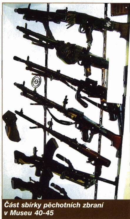
Část sbírky pěchotních zbraní v Museu 40-45

stových mužů v průběhu nejtvrdějších bojů. Dále vás prohlídkový okruh zavede do sutěrénu, odkud generálmajor Urquhart řídil bojové operace svých výsadkářů. Dnes tu na návštěvníka čeká několik ozvučených dioramat ve velikosti 1:1, která přibližují jednotlivé události bojů. Můžete spolu s Holanďany na ulici vítat příjezdějící Brity v okamžiku jejich triumfu, nahlédnout do polní ošetrovny v době nejtěžších bojů, sledovat práci radistů a štábu, nebo se podívat do postavení para-dělostřelců odrážejících německý útok. Podle vlastních zkušeností si myslím, že odsud určitě neodejdete zklamáni.