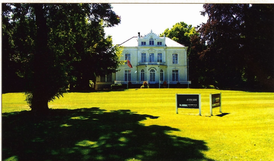
Airborne Museum Hartenstein

Unizozemského Arnhemu na Ryně se na konci září 1944 odehrála největší výsadková operace druhé světové války - operace Market-Garden. Dnes ji zde připomínají dvě muzea. Prvním z nich je Airborne Museum Hartenstein v Oosterbeeku, umístěné v hotelu, ve kterém sídlil po dobu bojů štáb generálmajora Roberta Urquharta, velitele 1. vzdušné výsadkové divize. Muzeum bylo založeno již v roce 1949 na památku britských a polských výsadkářů. Do svých současných prostor se přestěhovalo z Doorwertského zámku roku 1978. Expozice byla rozšířena a dnes návštěvníkům nabízí celkový pohled na operaci Market-Garden. U budovy, situované v parku nedaleko hlavního památníku, stojí tank Sherman a protitankové dělo z výzbroje kanadských vojáků, kteří v dubnu 1945 Arnhem definitivně osvobodili.