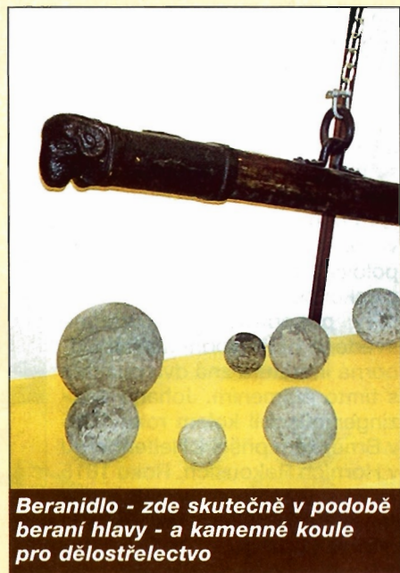
Beranidlo - zde skutečně v podobě beraní hlavy - a kamenné koule pro dělostřelectvo

Prostě - dělostřelectví a práce kolem byla odjakživa veliká věda. Však také kanonýři byli ctěni a brzy se stali elitou v armádách. Měli i různá privilegia, například ve Švédsku skýtala dělostřelecká pozice stejný azyl jako kostel. Pronásledovanému provinilci stačilo položit ruku na hlavě děla a pronásledovatelé se ho nesměli po tři dny do-