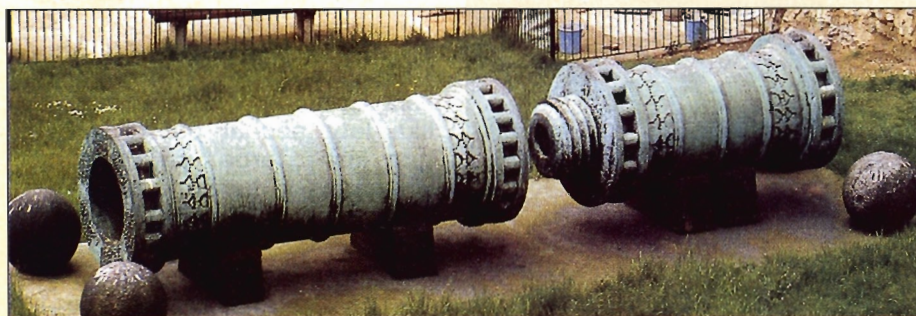
Jedno z děl sultána Mehmeda II. lze dnes spatřit před londýnským Towerem. Vpravo oddělená prachová komora.

Magnus (1193-1280) či Roger Bacon (1214-1294) znali střelný prach, ale až v polovině 14. století se téhle vymoženosti chopili vojáci. Jejich skvělé úspěchy s obřími děly odstartovaly v letech 1380-1520 první velký závod ve zbrojení. Každý zeměpán a každé město chtělo vlastnit nějaký ten „těžký kus“. Jednak proto, aby se vidělo, že si to mohou dovolit, jednak stavěli na odiv svou starost o poddané, jež bronzové monstrem mělo chránit.