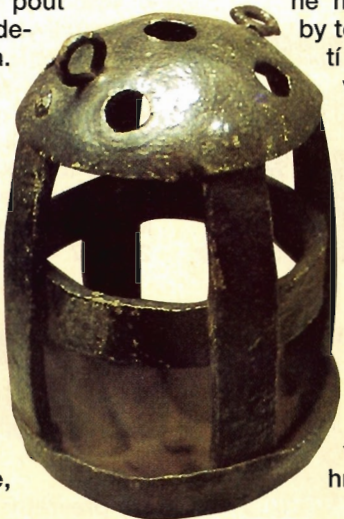
Starobylá zápalná „střela“ do hmoždíře se plnila před výstřelem žhavým uhlím

Vývojem neprocházela jen děla, ale také prach. Kolem roku 1400 byl střelcům znám jen jemný mletý prach. Jemná směs ledu, dřevěného uhlí a síry hořela ovšem velmi pomalu a navíc snadno zvlhla. Ale co bylo nejhorší, při dlouhých transportech v hrbolatém terénu se podle fyzikálních zákonů setřásala směs v sudcích tak, že dole se usadila síra, uprostřed ledek a zcela nahoře prach dřevěného uhlí. Tak jak určuje specifická váha každé ingredience. Mnohdy se ovšem stávalo, že směs se rozdělila jen částečně, přičemž vznikly směsi různých brizancí