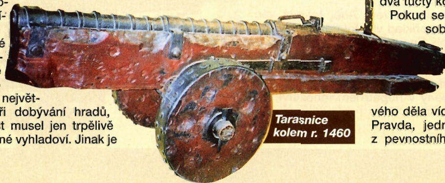
Tarasnice kolem r. 1460

Pokud se někomu zdá taková zásobna střeliva malá, je nutné vysvětlit, že to postáčílo na několik týdnů. Nebylo totiž v lidských silách nabít, zamířit a vystřelit z takového děla vícekrát než jednou denně. Pravda, jednou se jistému puškaři z pevnostního města Méty (Francie)