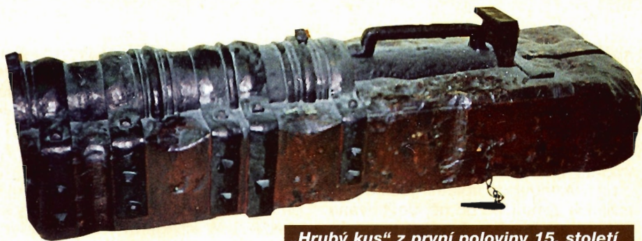
„Hrubý kus“ z první poloviny 15. století

povedlo zamířit a vystřelit na tři různé cíle. A to v jediném dni! Navíc všechny cíle zasáhl! Hned poté ale musel vykonat kajčnou zbožnou pouť do Říma, aby odvrátil podezření ze spolků s ďáblem.