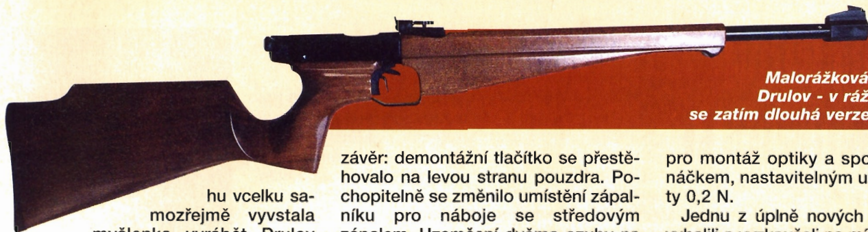
Malorážková „karabina“ Drulov - v ráži 22 Hornet se zatím dlouhá verze nevyrobí...

hu vcelku samozřejmě vyvstala myšlenka vyrábět Drulov rovněž ve „velkorážové“ verzi 22 Hornet.