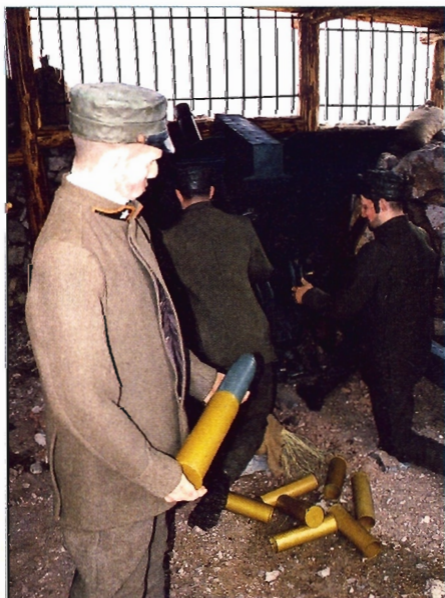
Italský 75mm horský kanon na Cinque Tori

Při cestě do Cortiny leží další hřbitov, kde je pochováno přes 1500 rakousko-uherských vojáků. Nedaleko se nacházejí starorakouské pevnosti,