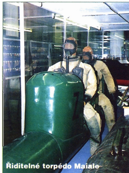
Řiditelné torpédo Maiale