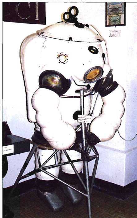
Těžký skafandr se používal do hloubky 100 metrů