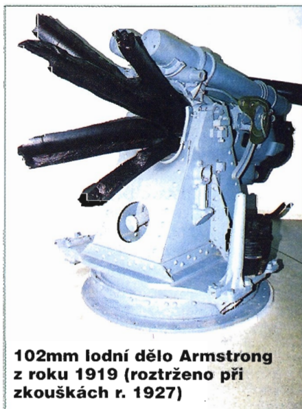
102mm lodní dělo Armstrong z roku 1919 (roztrženo při zkouškách r. 1927)

Idea věžové lodi byla pro malou stabilitu těchto plavidel záhy opuštěna a nahrazena lodmi barbetovými. Jeden z modelů představuje svého času největší a nejmohutnější plavidlo na světových mořích – italskou barbetovou loď Italia. V roce 1880 ji podle plánů B. Bri-