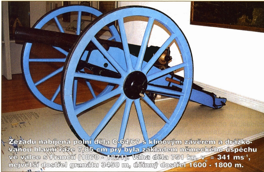
Ze zadu nabíjená polní děla C-64/67 s klínovým závěrem a dražkovanou hlavní ráže 7,85 cm prý byla základem německého úspěchu ve válce s Francií (1870 - 1871). Váha děla 751 kg, v = 341 \text{ ms}^{-1} , největší dostřel granátu 3450 m, účinný dostřel 1600 - 1800 m.

Ludvíka Viléma jich sice ztratilo 5000, avšak ukořistilo „154 kanonů, 10 000 stanů, 5000 koní, tisíce velbloudů, mul a buvolů a tureckou válečnou pokladnu, 54 beden měděných mincí“.