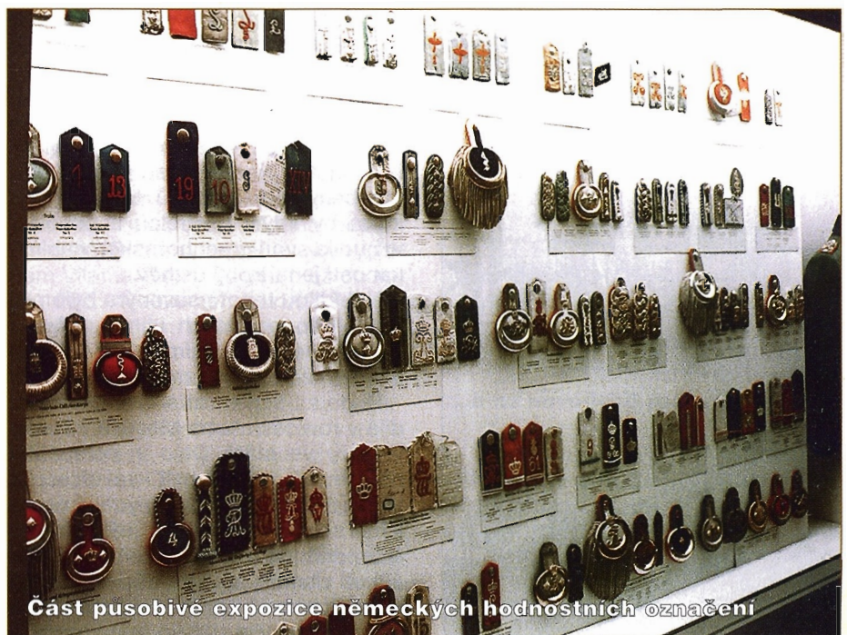
Část pasivní expozice německých hodnostních označení

Jak už bylo řečeno, muzeum přináší více informací jen v několika speciálních oborech. Kdo však má zájem právě o tuto problematiku, měl by se do Rastattu příležitostně podívat. ■