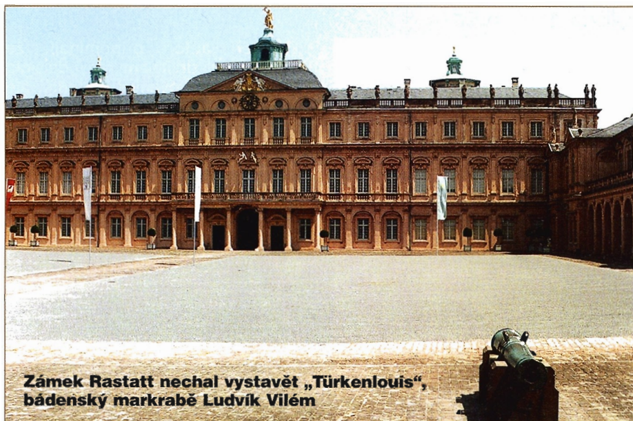
Zámek Rastatt nechal vystavět „Türkenlouis“, bádenský markrabě Ludvík Vilém

R astattské muzeum existuje od roku 1934 a v poválečném období až do sjednocení Německa mělo mnohem větší ambice: bylo budováno jako muzeum bundeswehru. Jenže roku 1996 ministerstvo obrany dalo přednost známému vojenskému muzeu v Drážďanech, kde jsou lepší podmínky pro umístění expozic těžké techniky než na rastattském barokním zámku - nemluvě o tom, že v Drážďanech asi předtím měli bohatší sbírky.