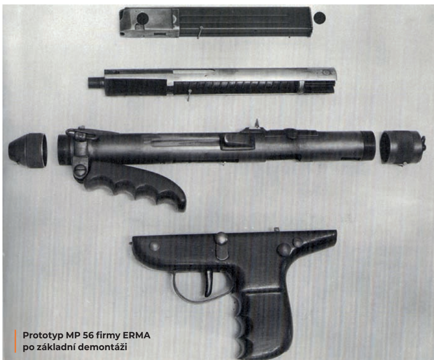
Prototyp MP 56 firmy ERMA po základní demontáži

Ve svých prvopočátcích byl bundeswehr vyzbrojen zejména ze zásob americké armády. V případě ručních palných zbraní se jednalo o pušky M1 Garand, karabiny M1 a M2, samopaly Thompson M1A1, kulomety BAR M1918A2 a Browning M1919A6, bazuky a mnoho dalších položek. Po (dobrovolném)