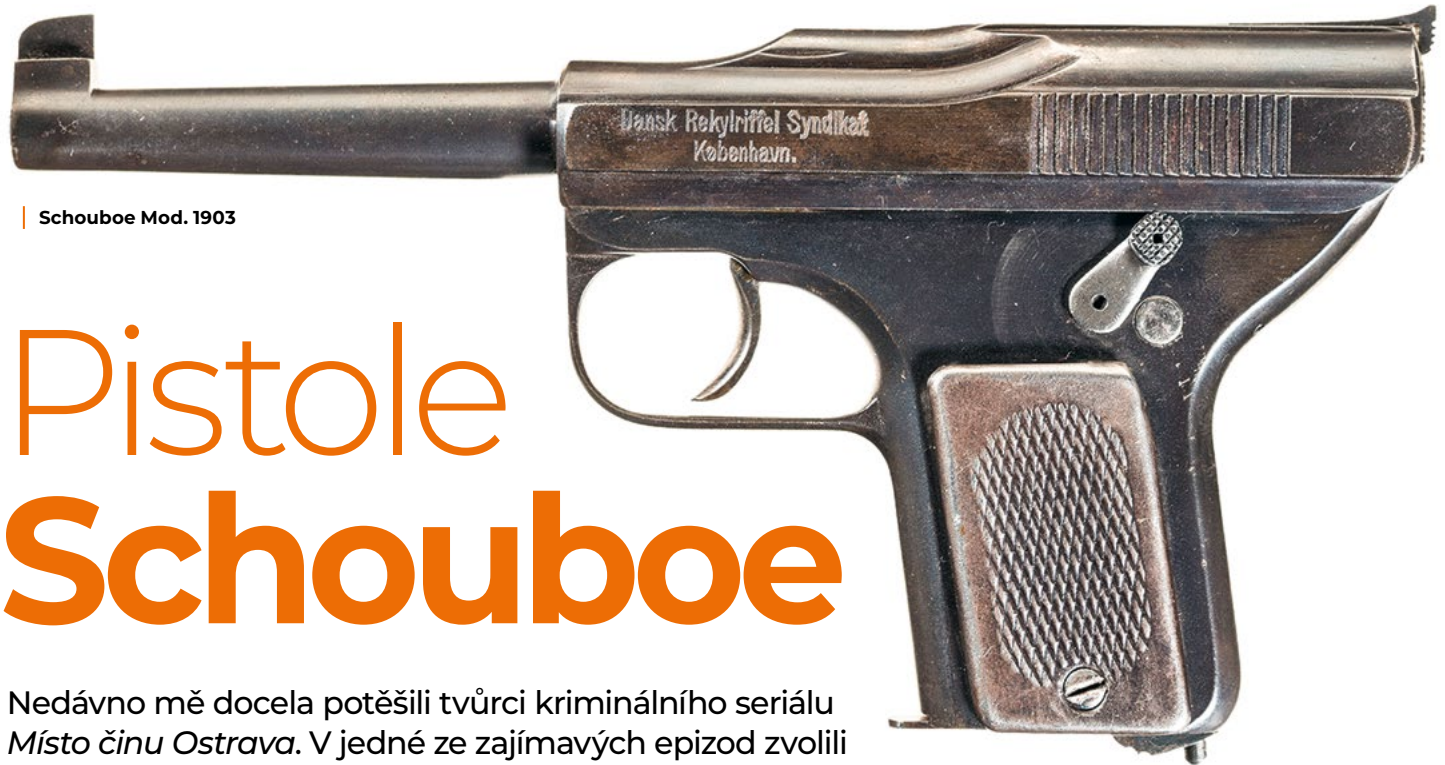
Schouboe Mod. 1903