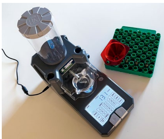
Frankford Arsenal Platinum Series Intellidropper

Výrobkem s velmi dobrým poměrem ceny a výkonu je Intellidropper od Frankfordu. Je to jeden z nejpokročilejších