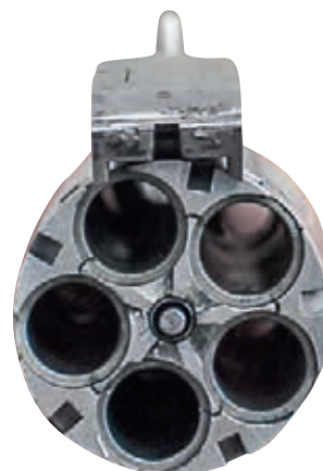
Válec má tradičně pět komor, zde na náboje 22 Magnum