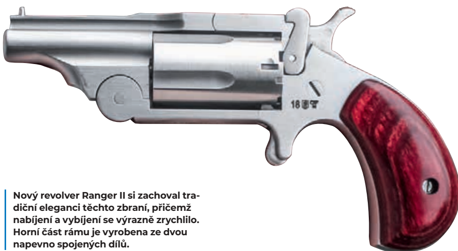
Nový revolver Ranger II si zachoval tradiční eleganci těchto zbraní, přičemž nabíjení a vybití se výrazně zrychlilo. Horní část rámu je vyrobená ze dvou napevno spojených dílů.

Přebíjení není zrovna rychlé ani pohodlné. Ale pokud zbraň nosíte nebo jen máte v nočním stolku proti rušitelům domácího klidu, kolikrát asi budete v chvatu přebíjet? V tomto případě je mnohem důležitější, že revoly jsou z nerezové oceli a odolají tudíž agresivnímu pro-