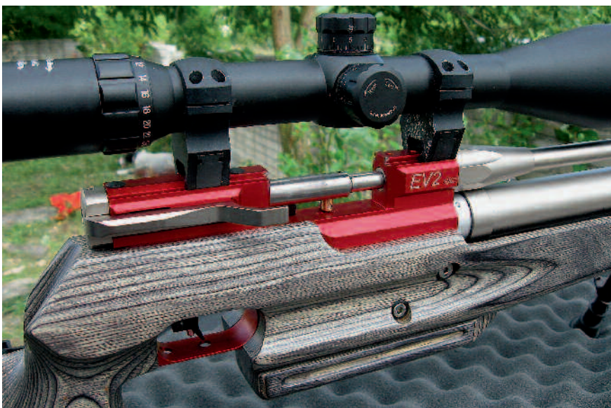
◀ Pouzdro závěru s ovládací pákou

lející ruky. Střelec tak má na výběr mezi dvěma způsoby držení zbraně. Buď s palcem obemknutým kolem rukojeti, nebo s palcem volně položeným ve vybrání. Ve spodní části předpažbí se nachází dlouhá hliníková lišta, vhodná pro montáž dvojnožky nebo jiného příslušenství.