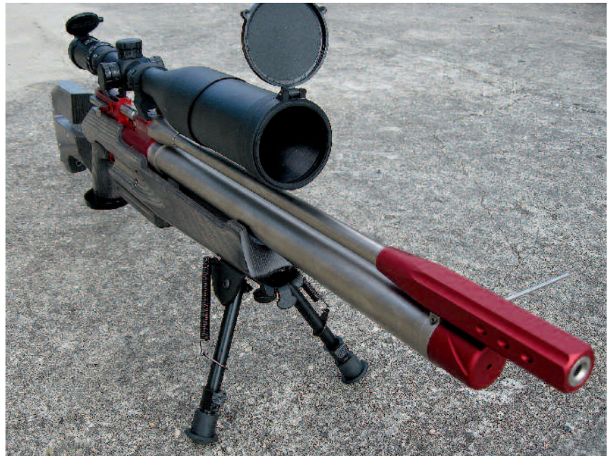
◀ Air Arms EV2

Pažba sportovního typu je vyrobena z vrstveného dřeva a obsahuje stavitelné prvky, které umožňují dokonalé přizpůsobení postavě střelce. Licnice je stavitelná jak ve vertikálním, tak i v horizontálním směru, lze ji tedy nastavit pro jakýkoliv typ střelecké optiky a libovolnou výšku montáže. Pažba je zakončena všestranně stavitelnou kovovou botkou. Výrazně dopředu skloněná rukojeť obsahuje ve spodní části rozměrnou plastovou opěrku, která však není stavitelná a stře-