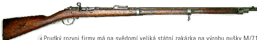
◀ Prudký rozvoj firmy má na svědomí velická státní zakázka na výrobu pušky M/71