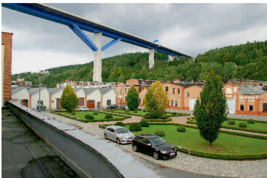
◀ Nad starým areálem Simsonovy továrny se klene nový dálniční most, vybudovaný, podobně jako většina dálnic v okolí, až po roce 1990

Výroba zbraní v Suhlu má dlouhou tradici. Drtivou většinu podnikatelů, kteří zde působili, tvořili Němci. Na rozdíl třeba od Lutychu, kde se kromě Belgičanů uplatnili i Francouzi a mnozí Němci, v Suhlu bylo národnostní složení podnikatelů velmi fádní. Mezi německé křesťany se ovšem občas dostal i německý Žid. Někomu to vadilo, někomu to nevadilo, ale až do nástupu Hitlera k moci mohli německí Židé v Německu podnikat bez zásadních problémů.