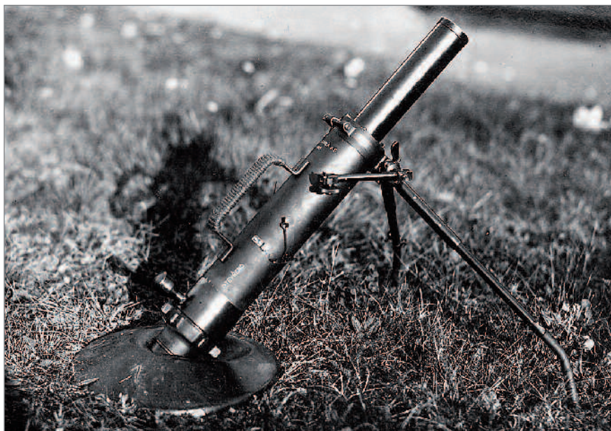
◀ Prototyp 4,7cm minometu z roku 1937, který byl vyroben podle projektu VTLÚ Zbrojovkou Brno. Při komparativních zkouškách se škodovským 5cm minometem B 6 se ukázal jako lepší. K jeho zavedení do výzbroje nedošlo.

Funkci velitele v letech 1925-1939 vykonával divizní generál MontDr. Ing. František Kolařík (1881-1950), jeho zástupcem byl brigádní generál Jaroslav Matička (1882-1970). V době okupace pokračoval ve své činnosti pouze II. letecký odbor VTLÚ v Letňanech, který byl v roce 1939 přejmenován na Letecký technický zkušební ústav a převeden pod pravomoc