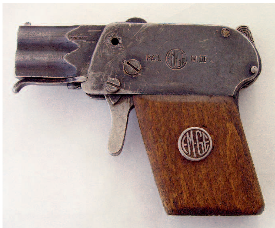
◀ EM-GE III z muzejní sbírky

Potom jsme jim ukázali zelený dolar s podobiznou prezidenta Washingtona. Oni ho začali líbat a někteří měli v očích slzy. A všichni chtěli, abychom jim ho věnovali. To ale moje maminka nechtěla. Byl to dárek od strýce z Ameriky, který mi ho před lety poslal k mému narození. Dolar byl celou válku opatrován jako oko v hlavě a byl jako právě vytištěný. Voják, který měl na opasku několik kořistních pistolí, sáhl do kapsy u košile, vyndal maličkou pistolku a nabídl mně, jedenáctiletému klukovi, výměnu.