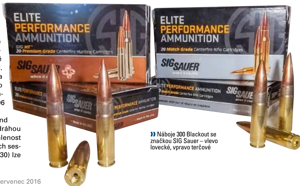
» Náboje 300 Blackout se značkou SIG Sauer – vlevo lovecké, vpravo terčové

26 Nosler se střelou AccuBond je prý šestapůlka s nejplošší dráhou letu, optimální nástřelná vzdálenost je u ní 350 yardů. U jejích větších ses-ter ráže 7 mm (28) a 7,62 mm (30) lze