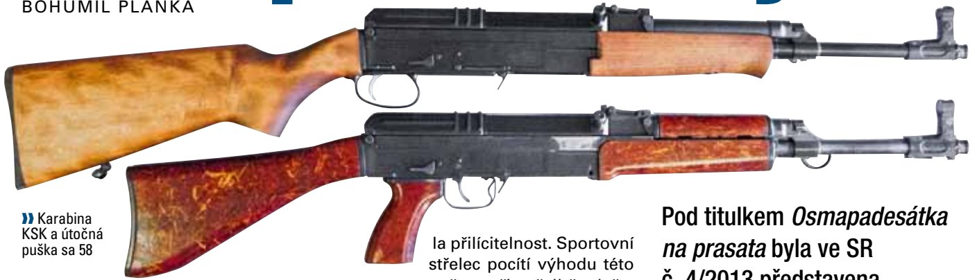
» Karabina KSK a útočná puška sa 58

J ak nasvědčuje bouřlivá diskuze nejen na internetu, byla karabina mysliveckou veřejností přijata s určitými rozpaky, které nepramení v technické kvalitě transformace, ale spíše z mysliveckých tradic. Pojďme se na tuto zbraň podívat podrobněji z technického i uživatelského hlediska. Zajímavé může být zejména porovnání s dalšími samonabíjecími (případně plně automatickými) zbraněmi na náboj 7,62 mm vz. 43 (7,62x39 CIP). Omezíme se jen na některé aspekty.