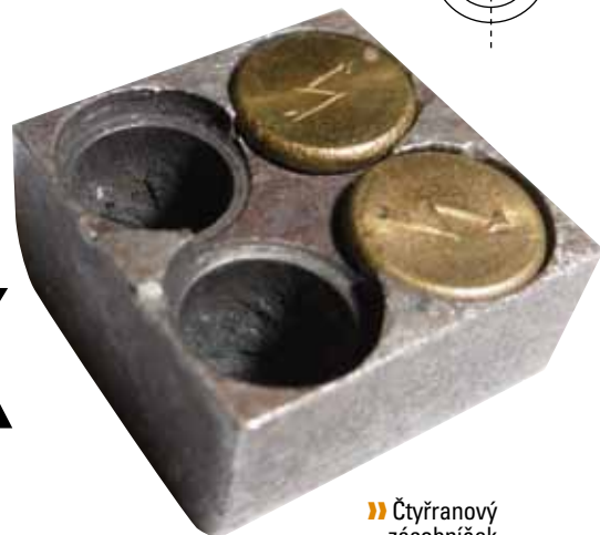
» Čtyřranový zásobník