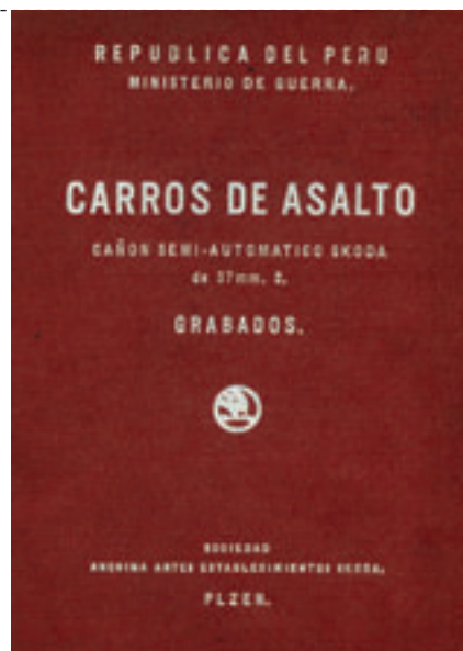
» Tankový kanon A3 z vojenského služebního předpisu pro tank Praga LTP