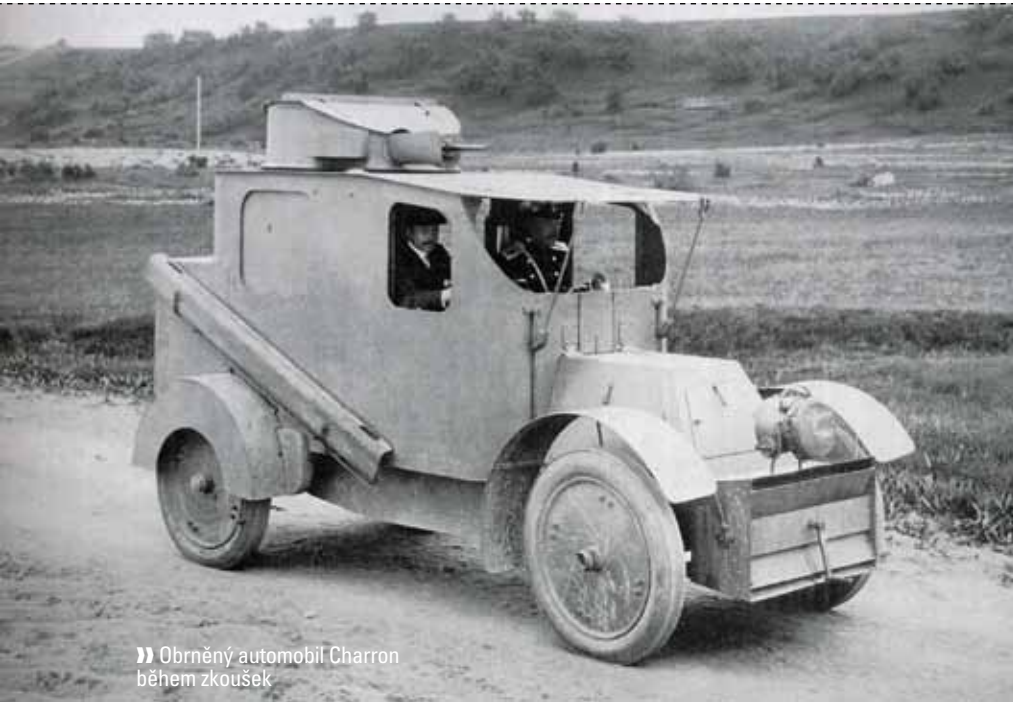
» Obrněný automobil Charron během zkoušek