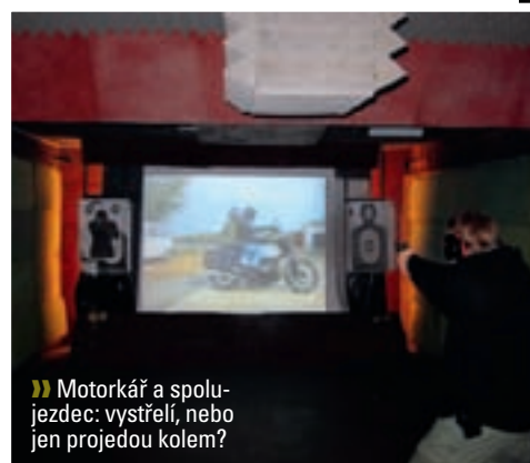
» Motorkář a společník: vystřelí, nebo jen projedou kolem?

útočník na plátně, zůstane zticha. Pokud obránce nestihne vystřelit dřív než útočník, čidlo pípnutím oznámí zásah. Pokud je ale obránce schovaný za překážkou tak, že čidlo „nevidí“ žádný ze zářičů, zůstane také potichu.