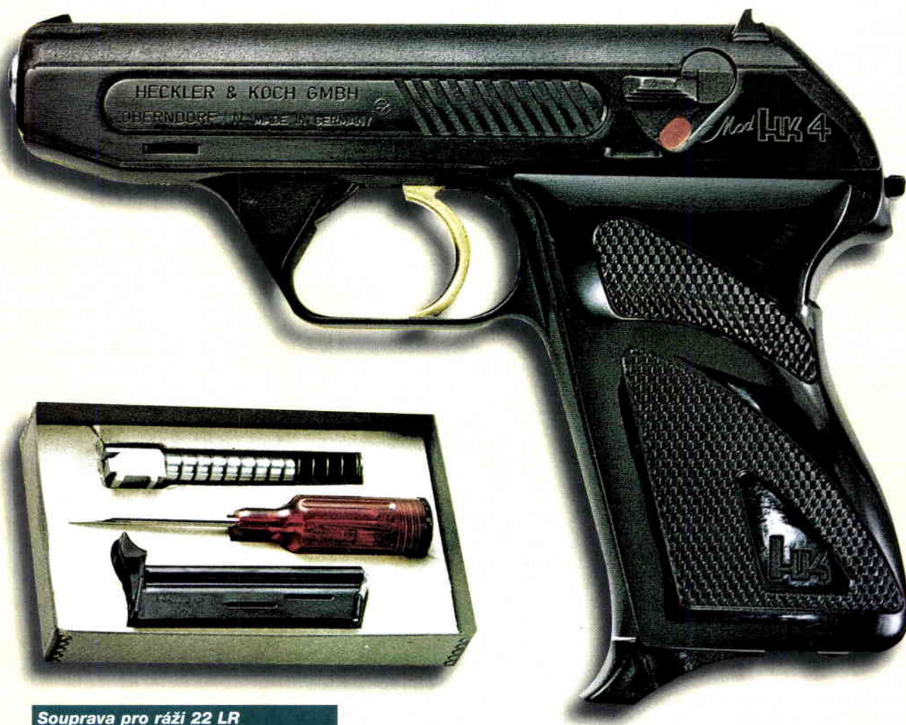
Souprava pro ráži 22 LR