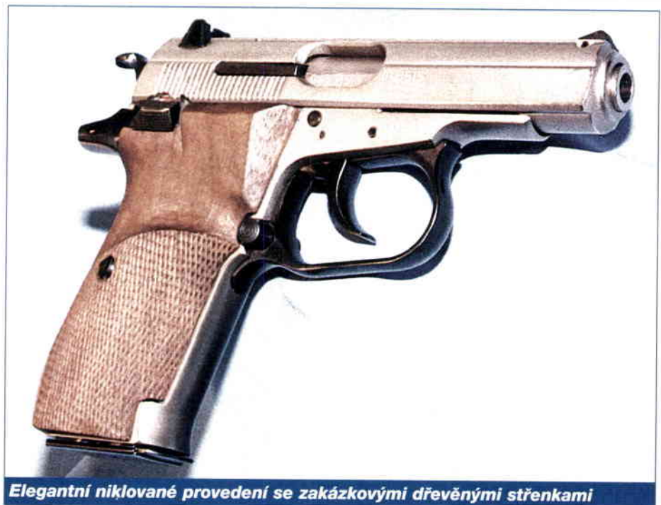
Elegantní niklované provedení se zakázkovými dřevěnými střenkami

CZ 83 má vysloveně pohodlnou rukojeť s dostatkem místa pro všechny prsty. Standardní plastové střenky jsou až přehnaně masivní, střelci s menší rukou se rukojeť zdá příliš objemná. Ale dobře udělané dřevěné střenky, jako byly na niklované pistoli, podstatně zmenší obvod rukojeti a ta pak vyhovuje i pro menší ruku. Poněkud sporná byla hluboce tvarovaná dřevěná rukojeť na pistoli