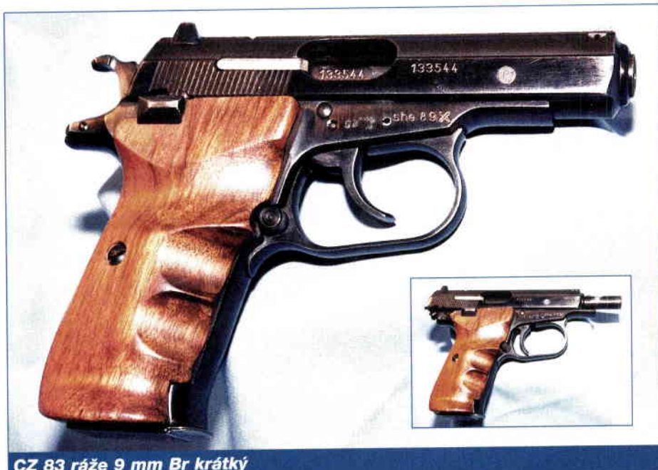
CZ 83 ráže 9 mm Br krátký

Redakce děkuje firmě Festa Benešov za spolupráci. ■