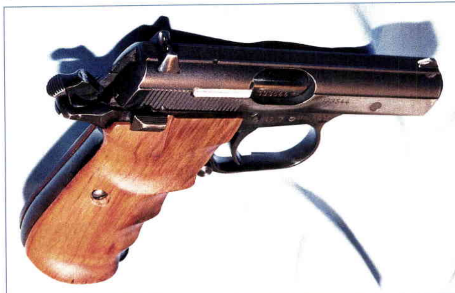
Mířidla CZ 83 jsou zvýrazněna bílou barvou