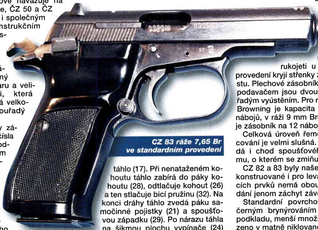
CZ 83 ráže 7,65 Br ve standardním provedení

Dvojitý spoušťový mechanismus byl zjevně inspirován CZ 75. Spoušť (14) fungující jako jednozvrtná páka působí na tlačné spoušťové