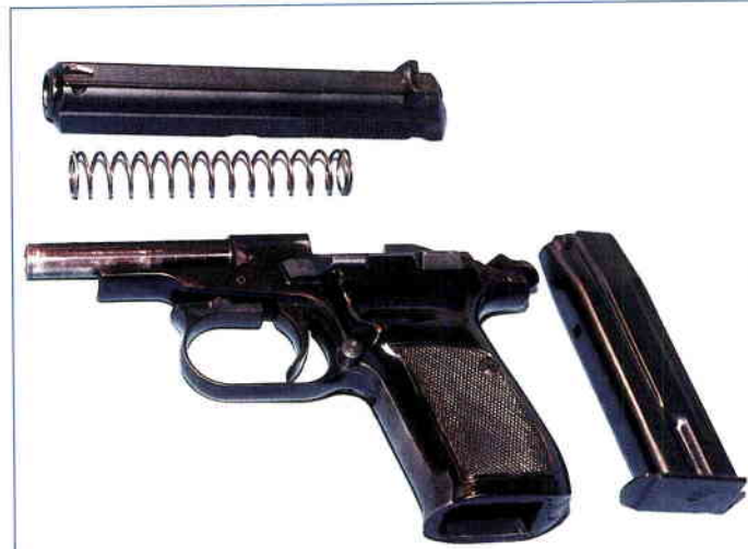
Rozebrání pro čištění i složení je jednoduché