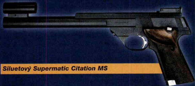
Siluetový Supermatic Citation MS

Rukojeť má tvar i rozměry odpovídající vojenským Coltům M 1911. Na malorážkové pistoli se zdá nepřiměřeně velká. Na dolní části rukojeti vpředu najdeme další typický znak pistolí Hi-Standard, záchyt zásobníku tvaru „U“, objímající dolní část rukojeti. Zásobník se uvolňuje zatažením za záchyt dopředu; zásobníky na