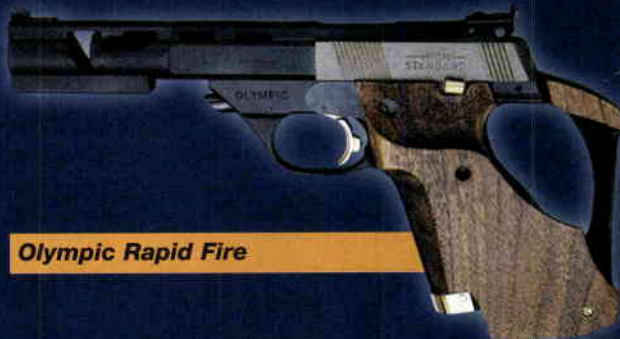
Olympic Rapid Fire

Konstrukce prvních modelů Hi-Standard poměrně těsně navazovala na Colt Woodsman. Postupně se vyvinuly některé odlišné znaky. Na rozdíl od Woodsmanu a evropských sportovních pistolí nemají soudobé Hi-Standardy hlaveň pevně spojenou s rámem. Tlačítko se šikmou plo-