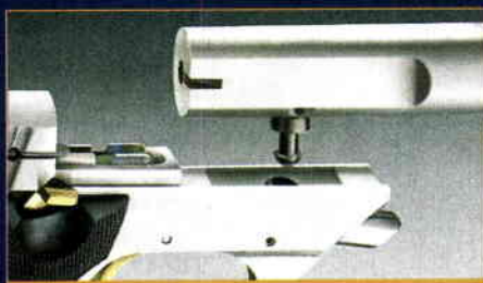
K uvolnění hlavně stačí stisknout tlačítko

V době své největší slávy Hi-Standard vyráběl mimo pistolí i další druhy zbraní: deringery, revolvery, malorážky, samonabíjecí a opakovací brokovnice.