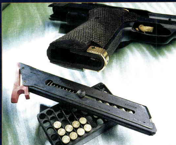
Do rukojeti rozměrů armádní pětačtyřicítky se zasunuje štíhlý zásobník na 10 nábojů 22 LR

straně. Pohybem nahoru blokuje spoušťovou západku. Záchyt závěru se na levou stranu nevešel. Najdeme ho vpravo pod závěrem.