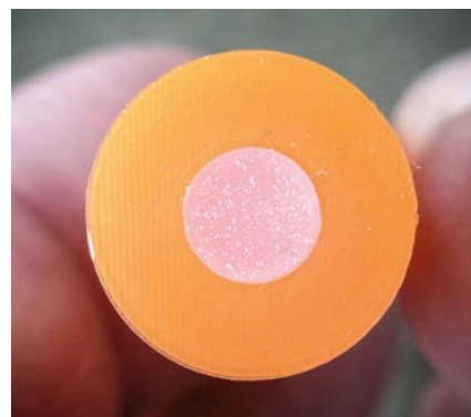
Silikonová vložka místo zápalky

kovových. Zápalky školních nábojů, jak celokovových, tak plastových, mohou být odpruženy malou pružinkou. Z Itálie jsou známé školní náboje z plastu, duté, s odpruženým mosazným kolíčkem nahrazujícím zápalku. Životnost tohoto provedení je ale problematická, častým používáním praská. K domácímu tréninku s nabíjením a spouštěním nasucho se dají koupit kvalitní celokovové náboje, většinou vyrobené z hliníkových slitin, s otvorem pro zápallík nebo s odpruženou ploškou místo zápalky. Tyto varianty ale nepatří mezi nejlacinější.