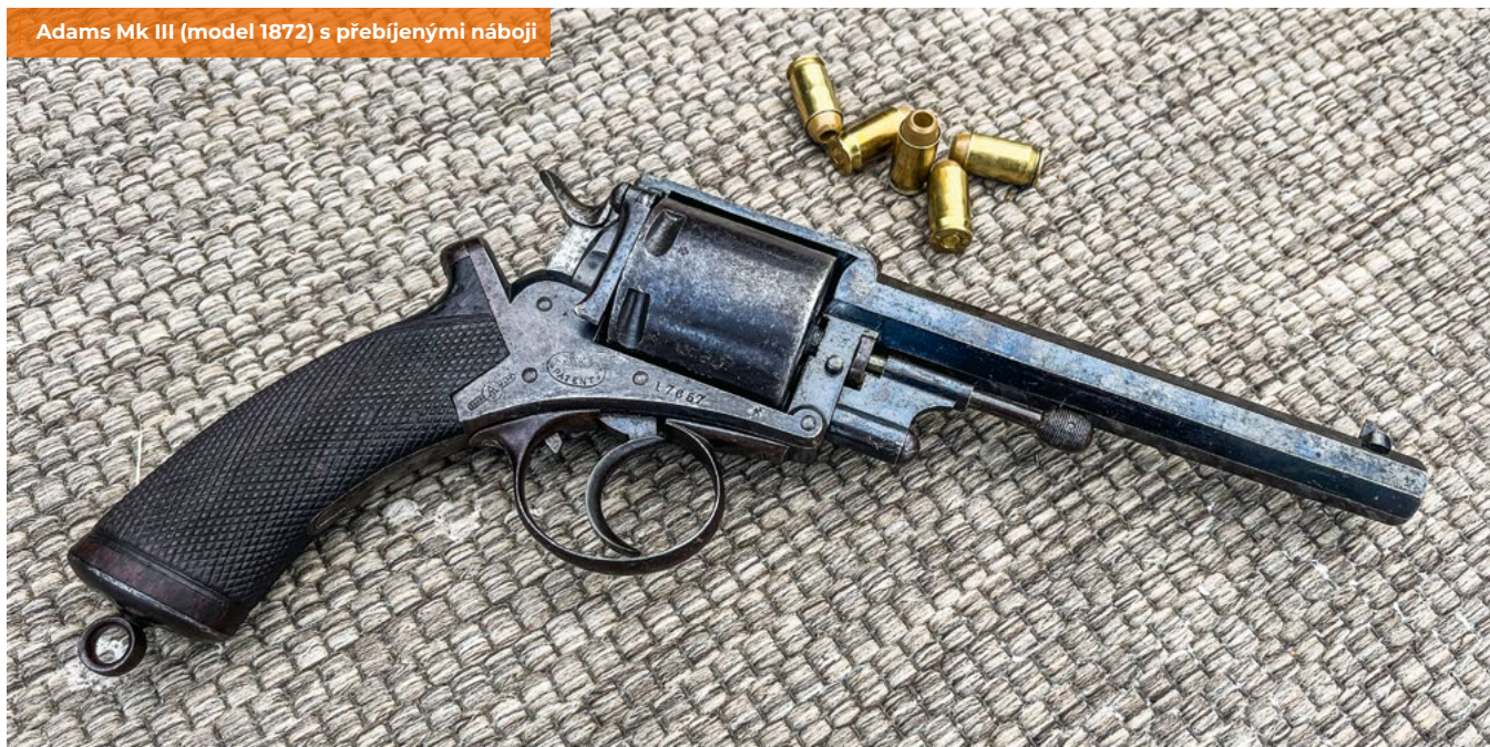
Adams Mk III (model 1872) s přebíjenými náboji

Při putování po českých střelnicích člověk občas narazí na zajímavé kousky. Některé se nevidí často, proto rád využiji možnost se s nimi prakticky seznámit. Jedním z nich byl britský armádní revolver Adams vzor 1872.