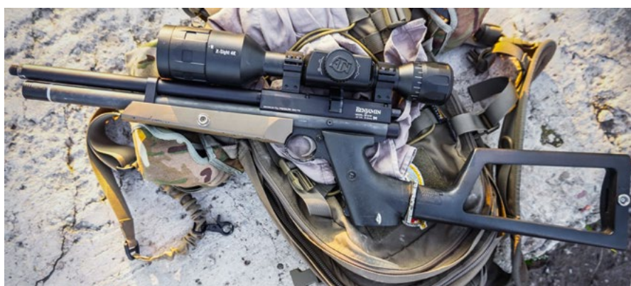
Crosman Benjamin Marauder je osvědčená volba pro rekreační střelbu

V našich končinách mají vzduchové zbraně silnou tradici. Kdopak by neznal třeba zla- movací vzduchovky Slavia. Technicky daleko pokročilejší jsou takzvané PCP vzduchovky ( Pre Charged Pneumatic ), v češtině poeticky nazývané větrovky. Namísto pístu operují s předem stlačeným vzduchem v tlakové nádobě.