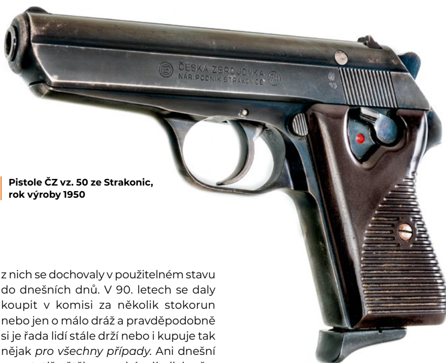
Pistole ČZ vz. 50 ze Strakonice, rok výroby 1950

z nich se dochovaly v použitelném stavu do dnešních dnů. V 90. letech se daly koupit v komisi za několik stokorun nebo jen o málo dráž a pravděpodobně si je řada lidí stále drží nebo i kupuje tak nějak pro všechny případy . Ani dnešní ceny totiž většinou nebývají nijak přemrštěné.